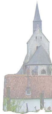
③ L'église Saint-Michel de Cormont bâtie au XV siècle, la tour centrale date de 1604.