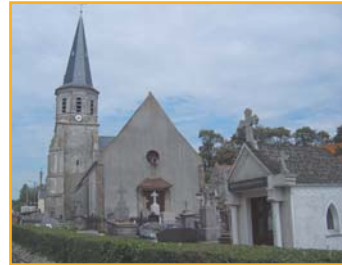
① L'église Saint-Martin de Frencq : tour romane et nef du XII siècle, statue tombale d'Enguerrand d'Éudin du XIV siècle.