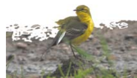
La bergeronnette printanière est typique des milieux ouverts des grandes cultures.