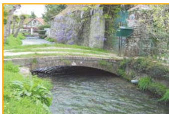
Le franchissement du Witrepin au niveau de Courteville.