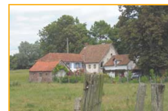
⑤ L'abbaye de Maresville se fond dans un décor champêtre.