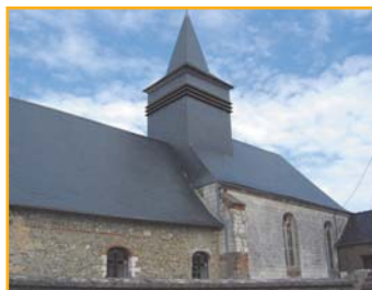
① L'église de Bréxent-Enoq a pour fonts baptismaux, un chapiteau du XIII siècle.