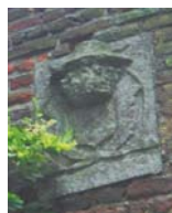
L'écusson de la Longue Roye