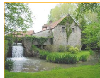
④ Le moulin de la Rocque cité pour la première fois en 857 est le doyen des moulins du pays de Montreuil. Le moulin actuel date de 1858 et il produisit de la farine jusqu'en 1938 environ (voir dépliant 5 - Les Hauts de Tubersent)